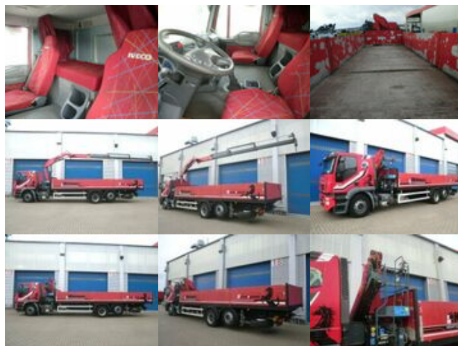
Iveco AT260S31Y/P 6x2 AT260S31Y/P 6x2 mit Kran Copma 150.3

Preis (brutto): 47.481,00 € Gesetzl. MwSt. 19%: 7.581,00 €