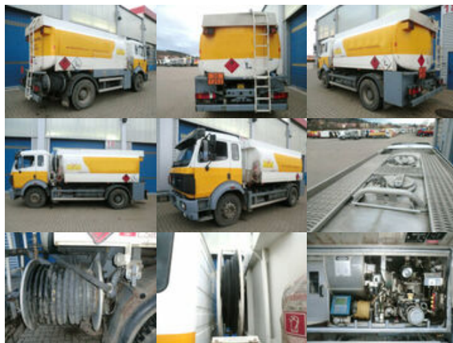
Mercedes-Benz SK 1824 L 4x2 SK 1824 L 4x2, Esterer Tankaufbau ca. 13.100l, 2 Kammern

Preis (brutto): 23.681,00 € Gesetzl. MwSt. 19%: 3.781,00 €