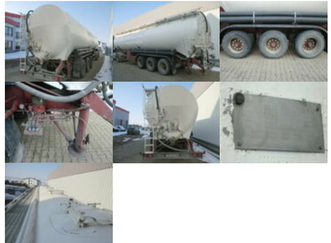
Kässbohrer SSK 56/10-24 SSK 56/10-24, Kippsilo ca. 56m 3

Preis (brutto): 8.211,00 € Gesetzl. MwSt. 19%: 1.311,00 €