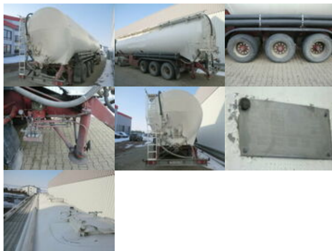
Kässbohrer SSK 56/10-24, Kippsilo ca. 56m 3

Preis (brutto): 8.211,00 € Gesetzl. MwSt. 19%: 1.311,00 €