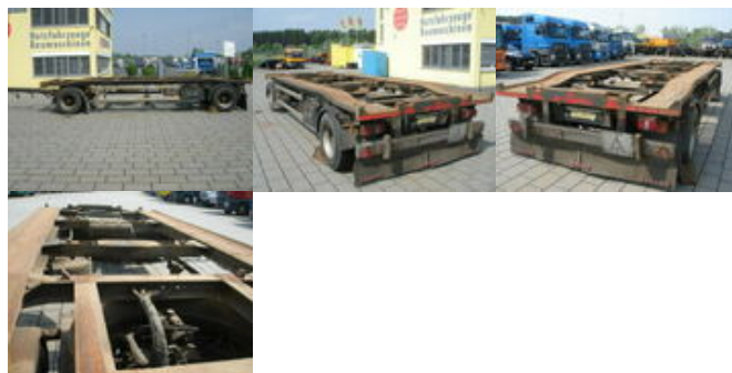
Hüffermann HAR 1870

Preis (brutto): 3.927,00 € Gesetzl. MwSt. 19%: 627,00 €