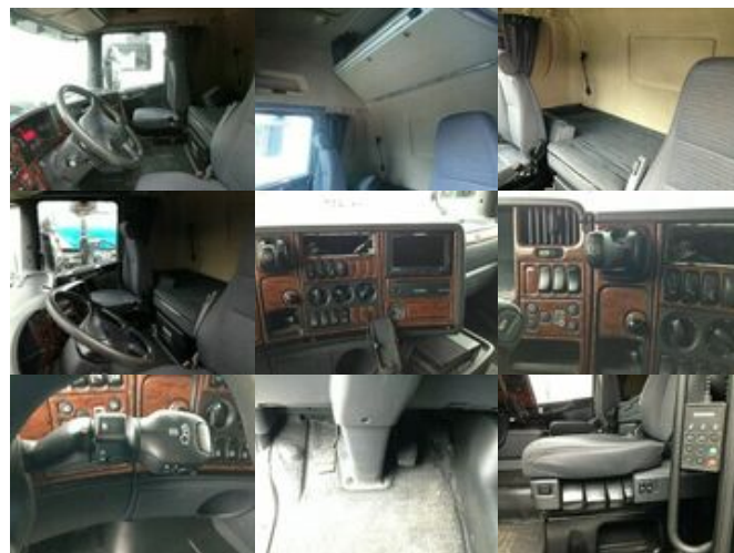
Scania R 420 4x2 R420 4x2 Lowliner, Twin Tec Rußfilterkat

Preis (brutto): 11.781,00 € Gesetzl. MwSt. 19%: 1.881,00 €