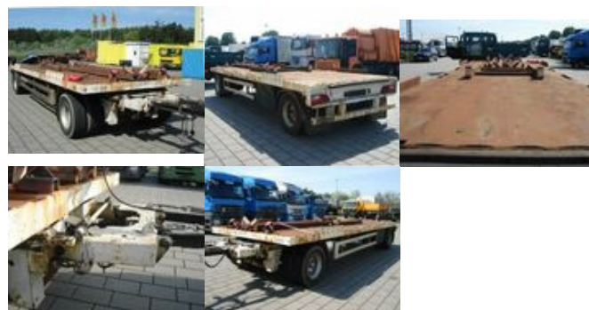
Renders Anh Containeranhänger Anhänger für Absatzcontainer

Preis (brutto): 3.451,00 € Gesetzl. MwSt. 19%: 551,00 €