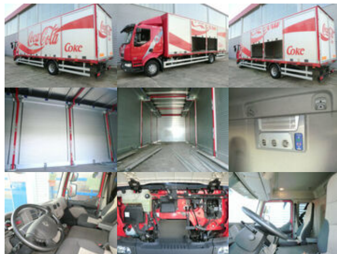
Renault Midlum 220 DXi 4x2