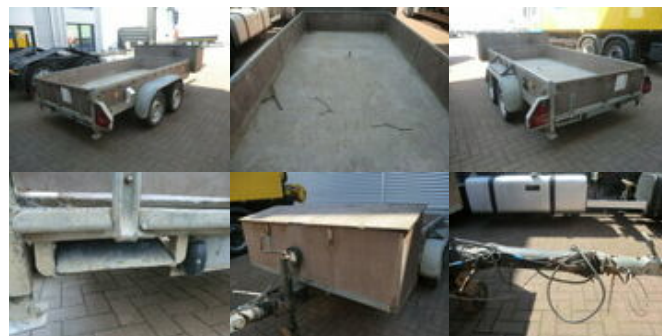
LEIBING - - LEIBING, 2.000 kg

Preis (brutto): 2.023,00 € Gesetzl. MwSt. 19%: 323,00 €