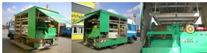
MAN M02 12.232 4x2 Spülwagen

Preis (brutto): 11.781,00 € Gesetzl. MwSt. 19%: 1.881,00 €