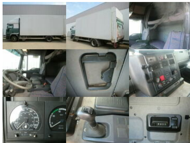
Iveco EuroTech 190E40 4x2 Euro Tech 190E40, Möbelkoffer, 49 cbm

Preis (brutto): 10.710,00 € Gesetzl. MwSt. 19%: 1.710,00 €