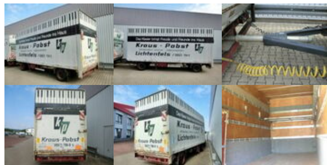
SOMMER - - Sommer AC 160 TL, Möbelkofferanhänger, LBW, 55cbm

Preis (brutto): 4.165,00 € Gesetzl. MwSt. 19%: 665,00 €