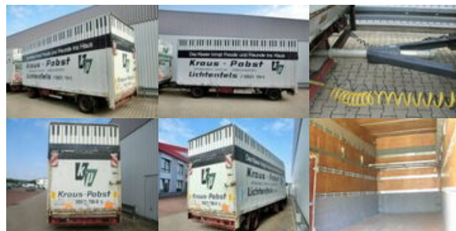
SOMMER - - Sommer AC 160 TL, Möbelkofferanhänger, LBW, 55cbm

Preis (brutto): 4.165,00 € Gesetzl. MwSt. 19%: 665,00 €