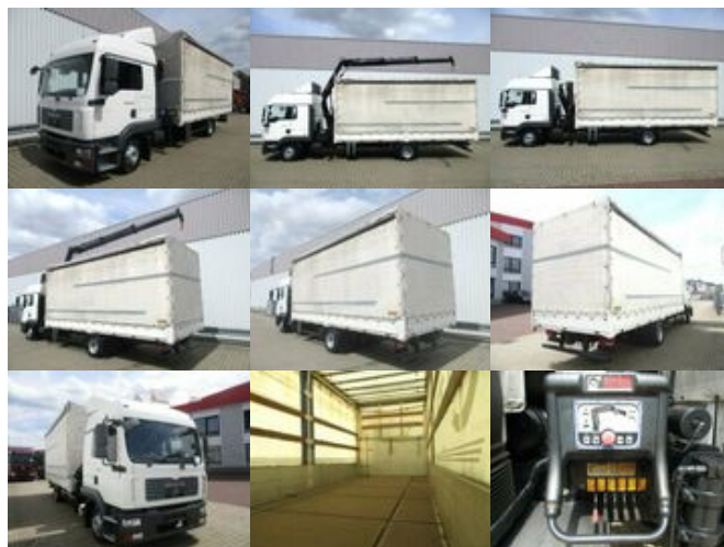
MAN TGL 12.240 BL 4x2 TGL 12.240BL 4x2, mit Kran Hiab 088 mit Funk

Preis (brutto): 27.251,00 € Gesetzl. MwSt. 19%: 4.351,00 €