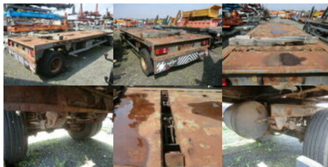
BEROE-LEISINGER AP 18 BEROE-LEISINGER AP18

Preis (brutto): 2.261,00 € Gesetzl. MwSt. 19%: 361,00 €