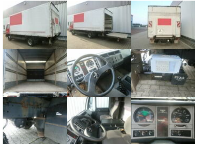
MAN L35 10.163 4x2

Preis (brutto): 4.641,00 € Gesetzl. MwSt. 19%: 741,00 €