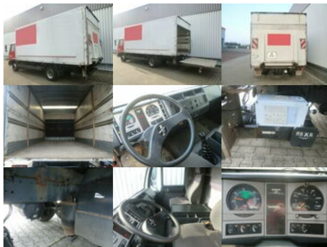
MAN L35 10.163 4x2

Preis (brutto): 4.641,00 € Gesetzl. MwSt. 19%: 741,00 €