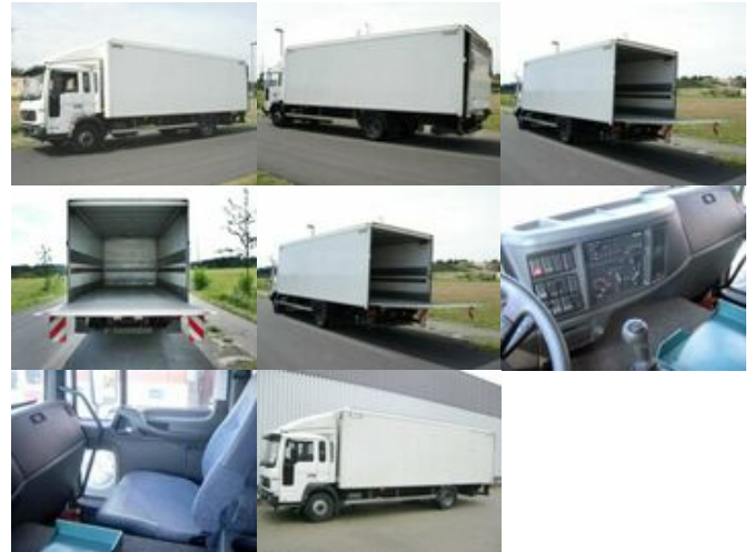
Volvo FL 6-12 4x2 FL 6-12 4x2, 4x vorhanden!

Preis (brutto): 7.021,00 € Gesetzl. MwSt. 19%: 1.121,00 €