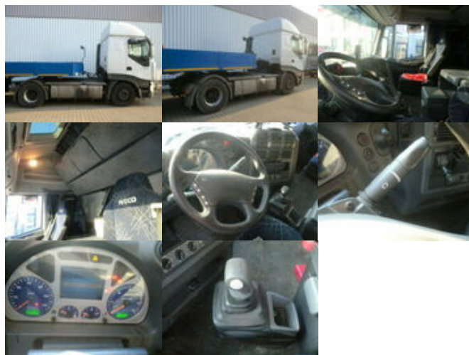
Iveco Stralis 440S43T/P 4x2 Stralis 440S43T/P 4x2, Kipphydraulik

Preis (brutto): 11.781,00 € Gesetzl. MwSt. 19%: 1.881,00 €