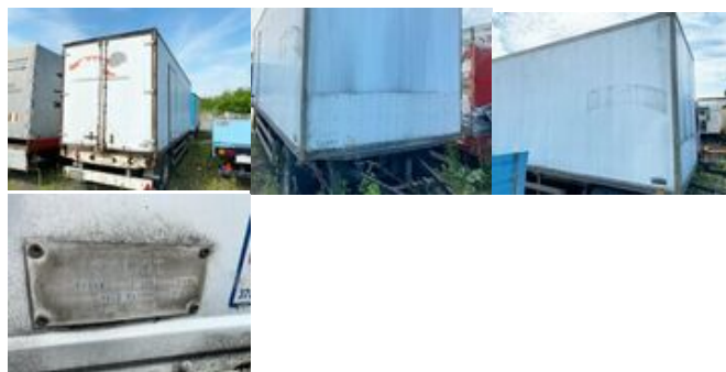
HOBJERG PL 20/7,35 HOBJERG PL 20/7,35

Preis (brutto): 2.975,00 € Gesetzl. MwSt. 19%: 475,00 €