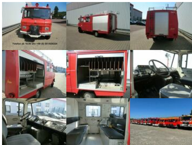
Mercedes-Benz LF 409 4x2 LF 409 4x2 Löschwagen, Benziner!

Preis: 9.000,00 € MwSt. nicht ausweisbar