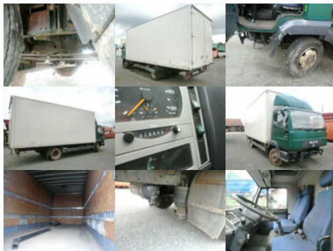
MAN L33 8.180 C 4x2 L33 8.180 C 4x2, Unfallfahrzeug mit Frontalschaden

Preis (brutto): 3.451,00 € Gesetzl. MwSt. 19%: 551,00 €