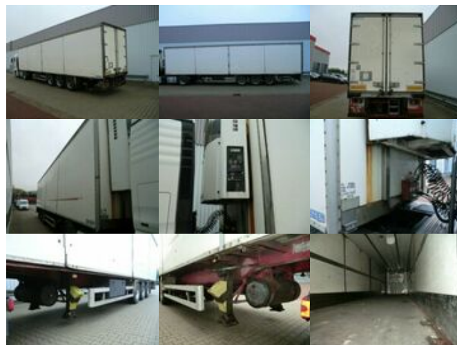
Ackermann-Frühauf - TC34CGN FRUEHAUF, FRANCE TC34CGN mit Aggregat Thermoking TK-1 30

Preis (brutto): 5.831,00 € Gesetzl. MwSt. 19%: 931,00 €