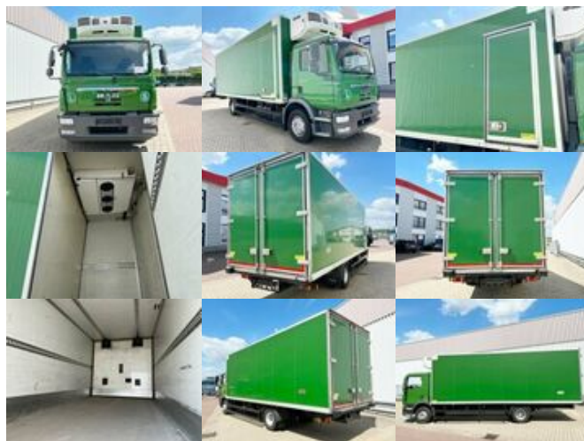
MAN TGM 15.290 4x2 BL TGM 15.290 4x2 BL, Tiefkühlkoffer

Preis (brutto): 20.230,00 € Gesetzl. MwSt. 19%: 3.230,00 €