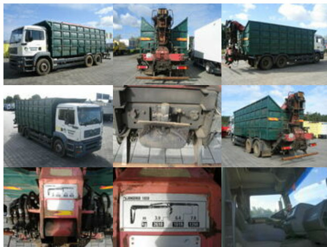
MAN TGA 26.413 BB 6x4 TGA 26.413 BB 6x4 mit Heckkran Jonsered 1020

Preis (brutto): 17.731,00 € Gesetzl. MwSt. 19%: 2.831,00 €