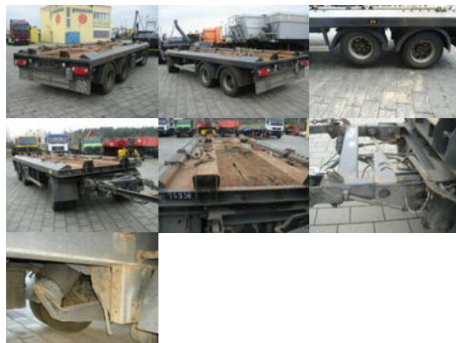
S-K-E-L-M-S-K ASM PA 24 SKELMSK ASM PA24, 2x Anh. f. Absetzcontainer

Preis (brutto): 9.401,00 € Gesetzl. MwSt. 19%: 1.501,00 €