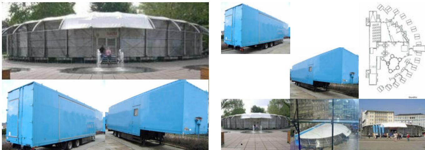
Wille Sanh SAK17 WILLE SAK17 mobile Ausstellungshalle Mega Jumbo

Preis (brutto): 58.310,00 € Gesetzl. MwSt. 19%: 9.310,00 €