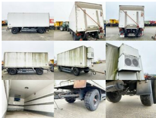
Rohr KA 18 ROHR 2-A-Kühlanhänger, LBW

Preis (brutto): 3.451,00 € Gesetzl. MwSt. 19%: 551,00 €