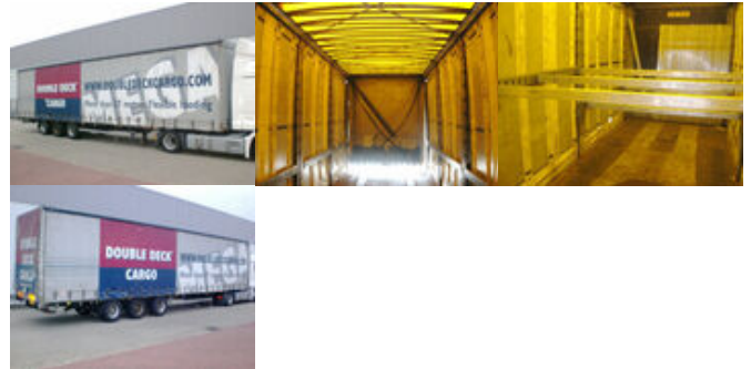
Hoffmann HSE - HSE, Mega, Jumbo

Preis (brutto): 4.641,00 € Gesetzl. MwSt. 19%: 741,00 €