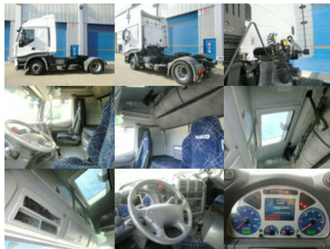
Iveco Stralis 440S45T/P 4x2 Stralis 440S45T/P 4x2

Preis (brutto): 28.441,00 € Gesetzl. MwSt. 19%: 4.541,00 €