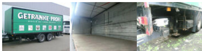
Koegel - ZFHB 18 ZFHB 18, Böse Getränkekoffer, BÄR LBW

Preis (brutto): 4.641,00 € Gesetzl. MwSt. 19%: 741,00 €