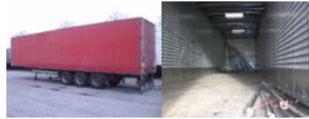
SOMMER SG 240-ATX Sommer Kleiderkofferauflieger, 90 cbm

Preis (brutto): 5.831,00 € Gesetzl. MwSt. 19%: 931,00 €