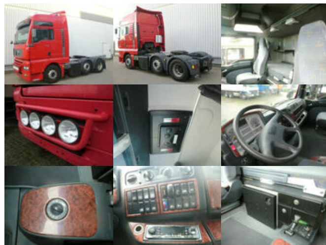
MAN TGA 26.463 FVLS 6x2