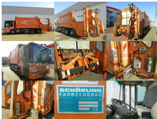
Mercedes-Benz Econic 2628L/NLA6x2/4 Econic 2628L 6x2-4 Schörling 3R11 22.5, Terberg Schüttung

Preis (brutto): 11.781,00 € Gesetzl. MwSt. 19%: 1.881,00 €