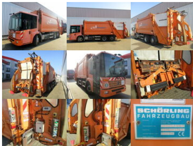
Mercedes-Benz Eonic 2628L/NLA6x2/4 Eonic 2628L 6x2-4 Schörling 3R11 22.5, Terberg Schüttung

Preis (brutto): 11.781,00 € Gesetzl. MwSt. 19%: 1.881,00 €