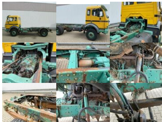
Mercedes-Benz SK 1824 AK 4x4 SK 1824 AK 4x4 Chassis

Preis (brutto): 20.111,00 € Gesetzl. MwSt. 19%: 3.211,00 €