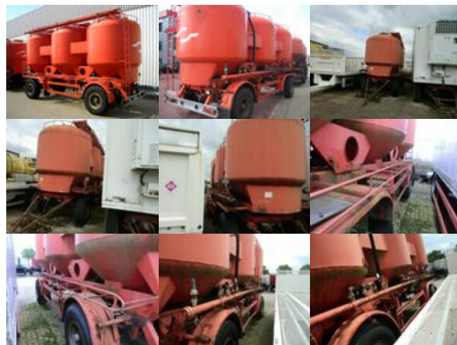
Koehler - B16/3 KOEHLER B16/3, ca. 23.250l, 3 Kammern

Preis (brutto): 4.998,00 € Gesetzl. MwSt. 19%: 798,00 €