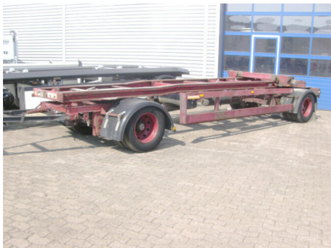
EGGERS HWT 18ZRL/1S EGGERS 2-A-Abrollanhänger, 7,5m Cont. Schlitten

Preis (brutto): 3.451,00 € Gesetzl. MwSt. 19%: 551,00 €