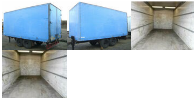
Ackermann-Frühauf TPW A8,6/5,6E

Preis (brutto): 2.975,00 € Gesetzl. MwSt. 19%: 475,00 €