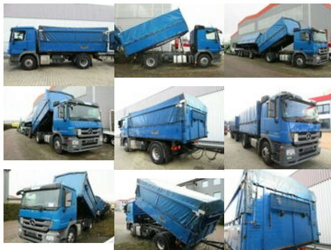
Mercedes-Benz Actros 1841L 4x2 1841L 4x2 Lück Getreidekipper, Retarder, MP3, 2x VORH.!

Preis (brutto): 29.631,00 € Gesetzl. MwSt. 19%: 4.731,00 €