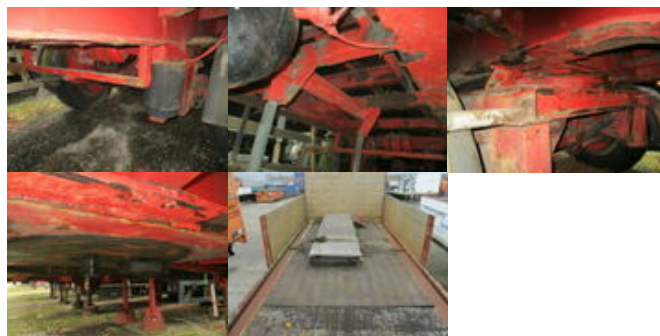
Schröder S 24-10-C-4-3 Schroeder S 24-10-C-4-3

Preis (brutto): 4.522,00 € Gesetzl. MwSt. 19%: 722,00 €