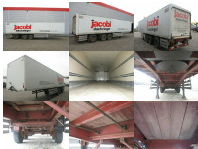
Koegel SAnh SF 24 SF 24 Kofferauflieger, gelenkte Achse, Rolltor, 77 cbm

Preis (brutto): 4.165,00 € Gesetzl. MwSt. 19%: 665,00 €