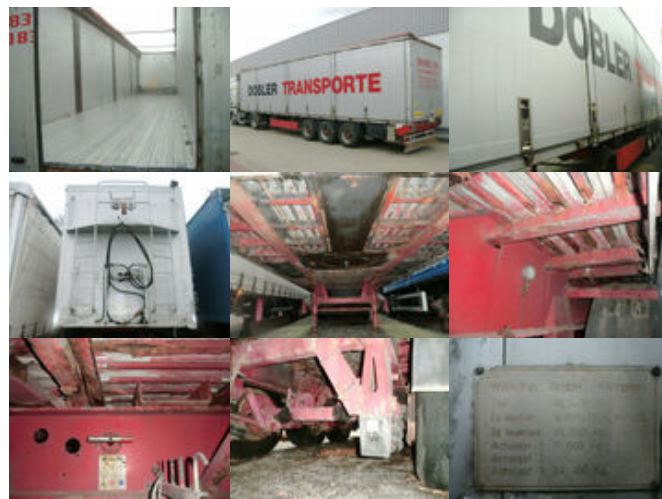
WALKLINER WLS 35/24 WALKLINER WLS 35/24, Walkingfloor mit Klappen linke Seite ca. 87m 3

Preis (brutto): 9.401,00 € Gesetzl. MwSt. 19%: 1.501,00 €