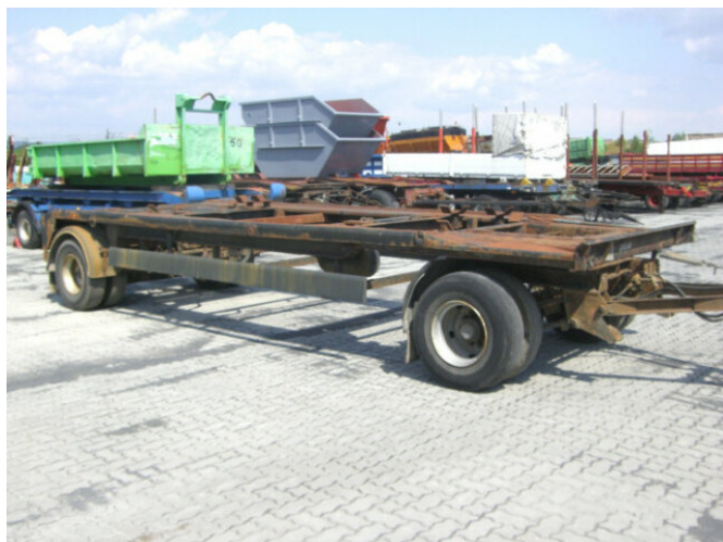
KOMPENHANS KHM 9105 KOMPENHANS KHM 9105

Preis (brutto): 2.261,00 € Gesetzl. MwSt. 19%: 361,00 €