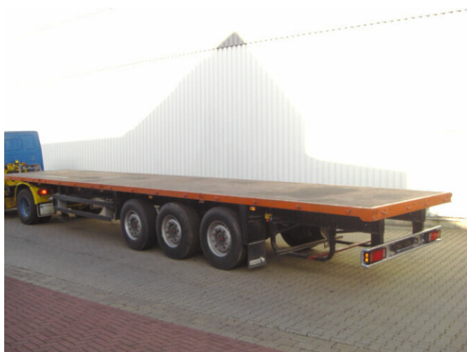
Schmitz SPR 24 SPR 24. 20x VORHANDEN!

Preis (brutto): 8.211,00 € Gesetzl. MwSt. 19%: 1.311,00 €