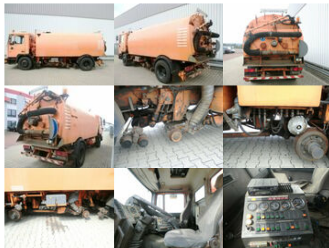
MAN M03 14.152 4x2 M03 14.152 4x2, Schienenkehrmaschine

Preis (brutto): 10.591,00 € Gesetzl. MwSt. 19%: 1.691,00 €