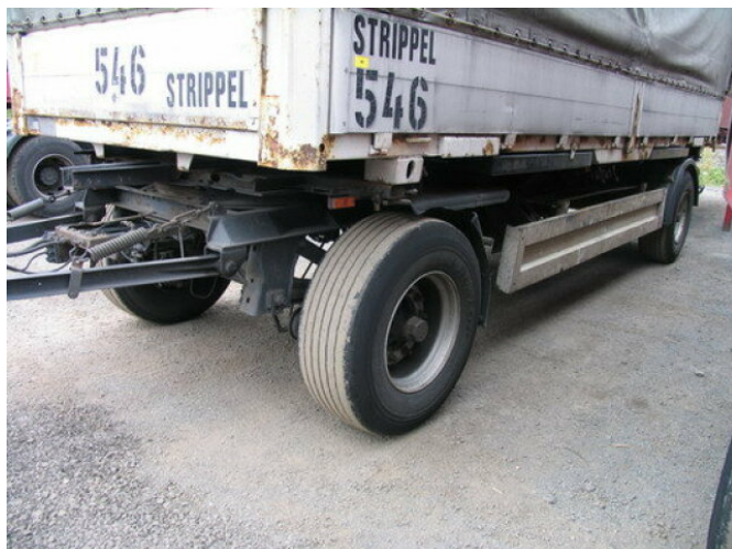
Krone AZW 18

Preis (brutto): 2.737,00 € Gesetzl. MwSt. 19%: 437,00 €