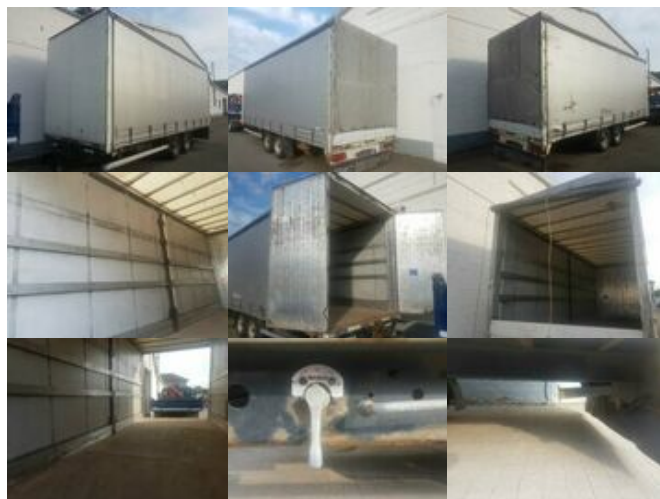
Müller-Mitteltal EAL-TA-P 10,5 TANDEM Müller EAL-TA-P 10,5 Tandempritsche

Preis (brutto): 7.021,00 € Gesetzl. MwSt. 19%: 1.121,00 €