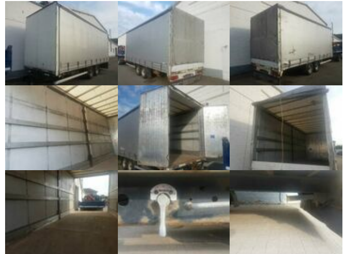
Müller-Mitteltal EAL-TA-P 10,5 TANDEM Müller EAL-TA-P 10,5 Tandempritsche

Preis (brutto): 7.021,00 € Gesetzl. MwSt. 19%: 1.121,00 €