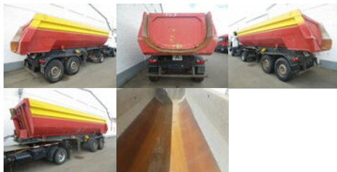
Kogel SKHL 18 SKHL 18 Alu Rundmulde, 24 cbm, Blechboden

Preis (brutto): 5.831,00 € Gesetzl. MwSt. 19%: 931,00 €