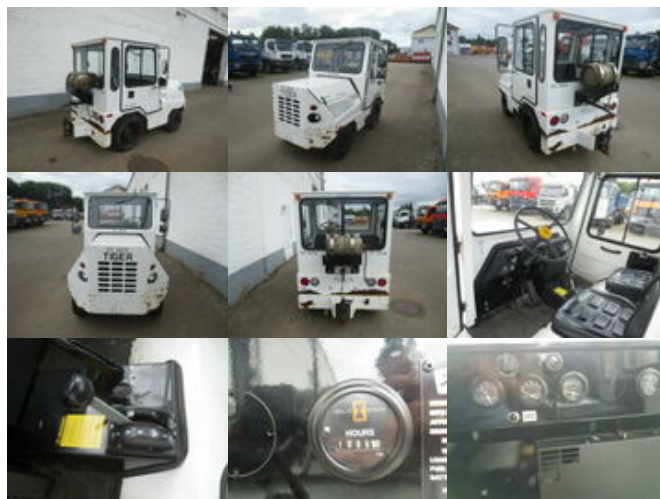
Sonstige Hersteller Tiger TC-50 Tiger TC 50, Zugmaschine

Preis (brutto): 4.641,00 € Gesetzl. MwSt. 19%: 741,00 €