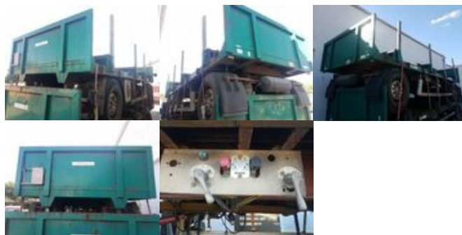
HOENKHAUS Anhänger Pritsche Plateau, Rungen, 3x vorh. !

Preis (brutto): 4.641,00 € Gesetzl. MwSt. 19%: 741,00 €