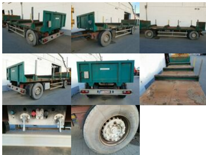
HOENKHAUS Anhänger Plateau Anhänger Pritsche Plateau, Rungen, 3x vorh.

Preis (brutto): 4.165,00 € Gesetzl. MwSt. 19%: 665,00 €