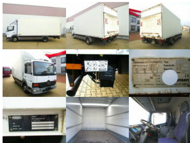
Mercedes-Benz Atego 815 4x2

Preis (brutto): 7.735,00 € Gesetzl. MwSt. 19%: 1.235,00 €