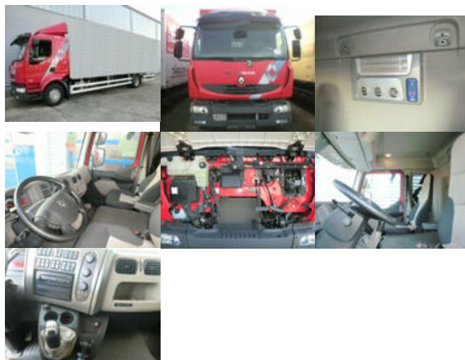
Renault Midlum 220 DXi 4x2 Midlum 220 DXi 4x2 mit Kran Palfinger PK 11001

Preis (brutto): 54.621,00 € Gesetzl. MwSt. 19%: 8.721,00 €